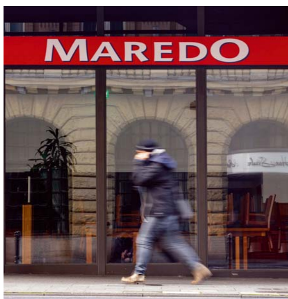
Alles auf Neuanfang Die Steakhauskette Maredo hatte schon vor der Pandemie Probleme und stellte rechtzeitig den Insolvenzantrag

in den nächsten Monaten als folgenschwerer Fehler erweisen. Denn tatsächlich betrifft diese Befreiung, die unnötige Insolvenzen verhindern sollte, nur jedes fünfte zahlungsunfähige Unternehmen, schätzt Patrick-Ludwig Hantzsch, Leiter der Wirtschaftsforschung bei der Auskunft Creditreform. Solche Befreiungen hatten sich zwar schon in der Vergangenheit zum Beispiel bei Hochwasserkatastrophen bewährt. Doch dieses Mal entstand ein Gesetz, das seit verganginem Frühjahr unzählige Änderungen und seitenlange Definitionen enthält, die selbst für Anwälte kaum durchschaubar waren – geschweige denn anwendbar.